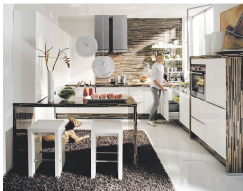
Die Funktion der Küche hat sich in den letzten Jahren verändert.

Platzverhältnissen und im Altbau lässt sich eine Wohnküche realisieren. Oft ist es möglich, das bislang abgetrennte Esszimmer baulich mit in die Küche einzubeziehen und einen großen Raum zu schaffen. Vor-