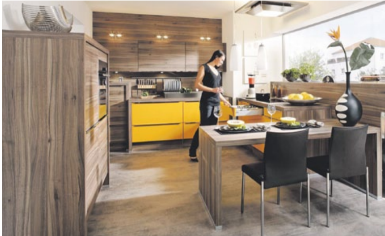
Geradliniges Design: Das ist die neue Küchengeneration.

Die Küche ist heute im Vergleich zu den anderen Wohnräumen völlig gleichwertig und nimmt daher beim Wohnen einen wichtigen Platz ein. Das liegt auch daran, dass moderne Küchen so schön sind, dass sie nur zum Kochen viel zu schade wären. Eine moderne Küche ist einladend wie ein bequemes Sofa. Sie ist elegant, gut beleuchtet, großzügig und sehr professionell. Optisch geht der Trend der neuen Küchen zu naturnahen Farben, gern in Kombination mit strukturartigen Oberflächen. So ist beispielsweise die sägeraue, fast natürliche Holzoberfläche bei Fronten sehr im Kommen. Sie wirkt haptisch einladend und ist immer höchst individuell. Zusammen mit lackierten oder folierten Fronten unterbricht sie die optische Uniformität und lockert den Gesamteindruck auf. „Materialkombinationen werden aber nicht nur aus optischen Gründen gewählt“, erläutert Frank Hüther, Geschäftsführer der